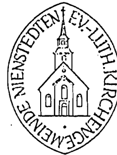
Nordelbisches Kirchenamt Kramer

Kirchengemeinde: Nienstedten Kirchenkreis: Blankenese Die Umschrift des Kirchensiegels lautet: Ev.-Luth. Kirchengemeinde Nienstedten.