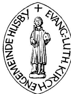
Nordelbisches Kirchenamt Kramer

Kirchengemeinde: Husby Kirchenkreis: Angeln Die Umschrift des Kirchensiegels lautet: Evang.-Luth. Kirchengemeinde Husby.